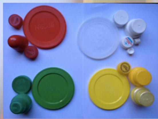
Por cores ...